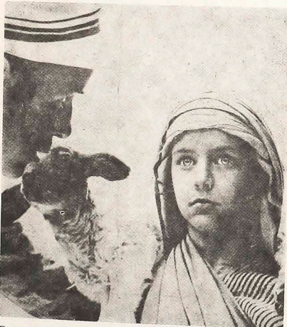
Cena do filme "Jesus de Nazaré" (apresentando a adolescência de Jesus) que tem levantado muitas controvérsias.

Aqui em Curitiba, o filme foi lançado no dia 16 de março, sexta-feira passada, e certamente, baterá o recorde de bilheteria.