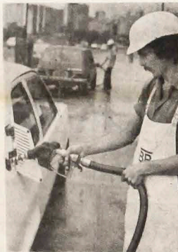
As medidas de racionalização foram as responsáveis pela grande economia que o Brasil conseguiu realizar em relação aos combustíveis.

A meta da racionalização não só permanece completamente atual, como o governo está vigilante sobre os níveis do consumo. O que parece ter mudado é o comportamento dos automobilistas brasileiros, agora bem mais responsáveis em relação ao uso dos combustíveis. Algumas medidas, como a limitação da velocidade a 80 km nas estradas, o bloqueio à venda de gasolina nos fins de sema-