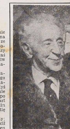
Arthur Rubinstein, najslawniejszy pianista czasów obecnych, obchodził niedawno 90 rocznicę swych urodzin.