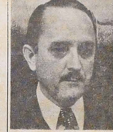
Brazylijski minister Pracy ARNALDO PRIETO, w wypowiedzi udzielonym prasie oświadczył, że myślał o przetożeniu jego ministerstwa jest: 1) przygotowanie ustawy o pozostawieniu 2) dać mu pracę i godne wynagrodzenie oraz 3) zapewnić opiekę robotnikom podczas pracy czy w razie wypadku. Wobec tego licznych wypadków w fabrykach i w sektorze budowlanym p. Minister zapowiedział powzięcie odpowiednich środków zaradczych.

Liczne kompanie amerykańskie eksploatują ropę naftową w krajach Ameryki Łacińskiej. Inwestycje tych kompanii oblicza się na 19 miliardów dolarów, co stanowi 7% wszystkich inwestycji USA poza granicami kraju. Spółród amerykańskich kompanii naftowych działających na obszarze Ameryki Łacińskiej wyliczył "Estadão" w artykule z 11 stycznia. "Exxon" (wydobywa 1,8 mln baryłek dziennie), "Creole Petroleum", "Occidental Petroleum", "Sun", "Gulf", "Occidental Petroleum", "Sun", "Gulf".