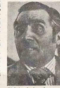
Finheiro de Azevedo — premier 6-ego gabinetu w Portugalii, po upadku Salazara — natrafia na wielkie trudności w utrzymaniu ładu i porządku w kraju z powodu licznych demonstracji skrajnej lewicy oraz buntu niektórych jednostek wojskowych.