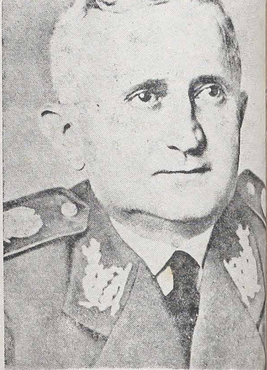
Marechal Eurico Gaspar Dutra ex-Presidente do Brasil, na dia 11 p. p. sepultado no cemitério São João Batista, na...

Nos meios militares, o marechal Eurico Gaspar Dutra sempre foi considerado um grande reformador e estadista. Nos altos postos que assumiu, principalmente quando em esteve à frente do antigo Ministério da Guerra, Dutra confirmou essa imagem: cimentou a disciplina, multiplicou os quartéis, fez surgir arsenais, especializou as militares, abriu estradas de ferro e de rodagem, planejou o melhor equipamento a sua arma, cuidou da disciplina e profissional do oficial, criou a biblioteca, organizou o ensino do Instituto de Geografia e História Militar. Como Ministro da Guerra foi um dos responsáveis pela implantação do Estado Novo, mas também um dos que para se candidatar à Presidência da República, venceu o primeiro pleito direto que se realizava desde 1930, vencendo em janeiro de 1951. Declarando-se "presidente de todos os brasileiros", colocou-se acima dos partidos, a fim de que o país tivesse as condições necessárias para elaborar sua constituição que ficou pronta em setembro de 1954, quando o retorno ao federalismo. Procurou a conciliação, mitigando que várias correntes políticas fizessem parte de seu governo, através do acordo interpartidário celebrado PSD, UDN, e PR.