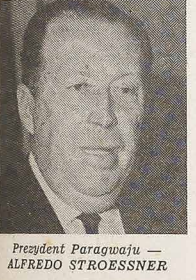
Prezydent Paragwaju — ALFREDO STROESSNER

Podczas wizyty prezydenta Paragwaju w Brazylji — Alfredo Stroessnera zatwierdzono oficjalnie budowę odbiorczej elektrowni wodnej w Itaipu przy siedmiu spadach rzeki Parany. Powstała w ten sposób przedsiębiorstwo brazylijsko-paragwajskie i a