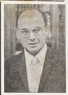
Prezydent Meksyku — Luis Echeverria powołał już do kraju po 2-tygodniowej podróży do kilku państw Europy, Bliskiego i Dalekiego Wschodu. M. in. bawił on w Moskwie i w Chinach. Praktycznym celem podróży Echeverria było nawiązanie stosunków handlowych, jak np. z Chinami, które importować mają towary z Meksyku za sumę 3 mln. dolarów. Szej Meksyku zapomniał naród, że wymiana handlowa z państwami socjalistycznymi nie wpływa na zmianę polityki zagranicznej kraju.

padło tam ponad 20 tysięcy robotników. Każdego roku od 13 do 14 tys. statków pod różnymi banderami przejeżdża przez kanał o globalnym tonażu 100 milionów. Ruch ten zwiększa się z roku na rok, tak, że w 1985 r. prawie 18 tysięcy statków przevine się przez ten kanał. Zmusi to Amerykanów do budowy nowych szluz lub też do otwarcia drugiego kanału podobnego. W zonie kanału Panamskiego pracuje około 20 tysięcy funkcjonariuszy, z tego 15 tys. Panameńczyków. Ci ostatni zajmują 54% stanowisk w administracji zony kanału. Administracja kanału wydała dotąd 78,7 mln. dolarów na pensje swych funkcjonariuszy oraz 25,4 mln. dolarów na różnego rodzaju zakupy w Panamie. Stany Zjednoczone godzą się na zwiększenie opłaty rocznej wynoszącej obecnie 2 miliony dolarów, na zmniejszenie zony kanału do minimum, oddając resztę obszaru w ręce Panamy oraz pragną rozbudować obecny kanał lub otworzyć nowy (na poziomie morza — bez szluz) na podstawie nowej umowy z Panamą.