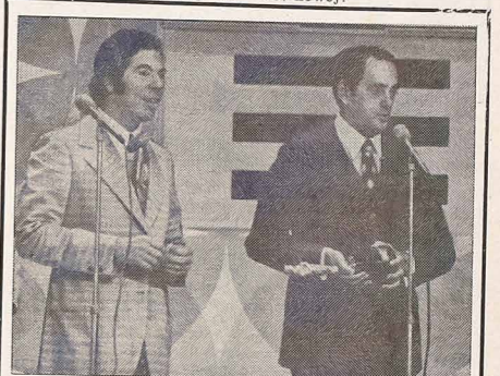
Najpopularniejsze programy niedzielne TV rioskiej i państwa kierowane przez znakomitych spikerów Flavio Cavalcanti i Silvio Santos. Programy te trwają od 6 do 8 godzin. Nie brak jednak przeciwników tych programów, którzy uważają je za zbyt apodyktyczne tj. nie podlegające krytyce względnie omyłce, oraz zbyt nasycone sensacją.

najnowsze bronie, a USA bombardują Półn. Wietnam i zakładają miny w portach tego kraju. Mimo tego — Breżniew przyjmie Niksona w Moskwie jakby nigdy nie i podpisuje z nim traktat o ograniczeniu broni ofensywnej. Jednakowoż największą trudnością dla Niksona jest problem wewnętrzny USA, czyli istnienie 5 milionów bezrobotnych, w tym 200 tys. ludzi młodych, którzy powrócili ze służby wojskowej.