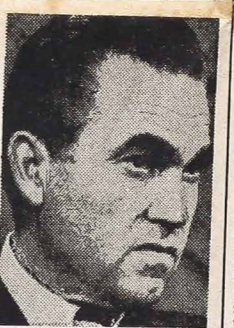
Gubernator stanu Alabamy — George Wallace po ostatnim nadaniu bez władzy w ręk. Miał on wszelkie szanse, by zostać głównym kandydatem na prezydenta USA z ramienia partii demokratycznej. Obecnie jednak będąc kandydatem musiał zrezygnować ze swego ambitnego planu. Miejsce Wallace'a zajął — jak wiadomo — McGovern.

Opócz atmosfery — powietrza którym oddychamy, istnieje inna atmosfera tj. warunki (środowisko) w jakich żyje większość ludności na świecie. Ludność ta zastępuje na to, by zając się bliżej jej losem, czyli ekonomicznie i technicznie. Jak oświadczył bowiem jeden z obecnych rzeczowników, bo każdy z 18 latych produkcja rolna na świecie musi zwiększyć się podwójnie, by żywić nowe miliony ludzi. A więc ONZ musi wspomóc narody biedniejsze, udzielać im długoterminowych pożyczek oraz zagwarantować im asystencje techniczną w rolnictwie. Minister w zakończeniu przedstawił zebrany delegatami obecny stan rzeczy w Brazylii.