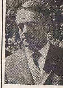
Sargent Shriver, wiceprezydent Edwarda Kennedy'ego (na zdjęciu) został oficjalnym kandydatem na wiceprezenta USA z ramienia partii demokratycznej.