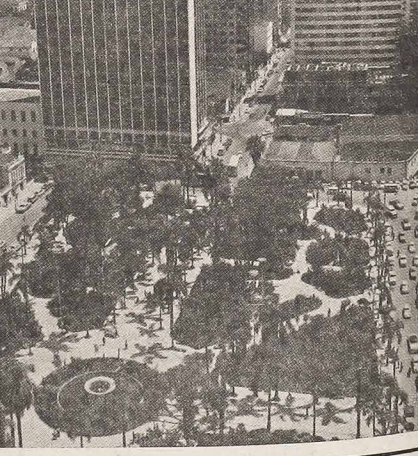
Bela e imponente vista da Praça Osório, em Curitiba, com seus arranha-céus. Graças às obras da Prefeitura Municipal, esta Praça constitui um lugar predileto para as crianças brincarem a vontade, aproveitando as instalações para os divertimentos infantis.

Wilson João Eu diria: sentimos demais a morte porque somos demais terrenos, demais apegados a esta terra cheia de dores, de lágrimas e que está condenada à destruição. Somos apegados demais às coisas que passam. A morte não assusta a quem ama. A quem vive em função de valores espirituais. São essas realidades que não passam