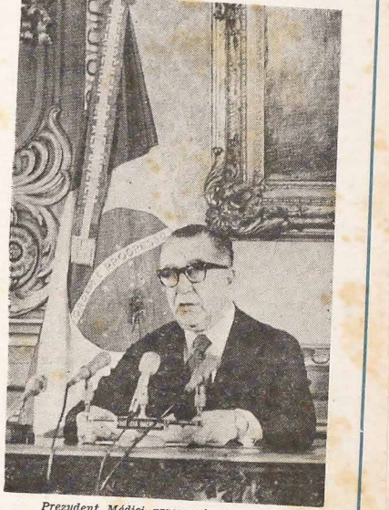
Prezydent Médici przemawia do narodu.