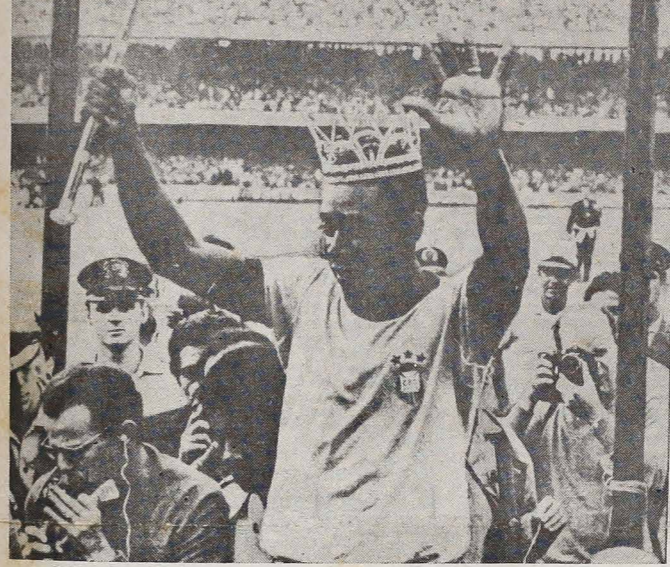
Pelé, król futbolu, z koroną na głowie i berłem w ręku - pożegnał się z jedenastką Brazylji w meczu z Jugosławią...