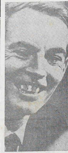
Prof. Christian Barnard, sławny chirurg - pionier w przeszczepianiu serca, bawił w przeszczepianiu w Rio, udając się do Argentyny. Do Brazylji powrócił on w kwietniu, by wygłosić szereg odczytów.

Nowy blok polityczny, o którym mówiliśmy w poprzednim numerze "Ludu", odniósł swo pierwsze zwycięstwo: Członkowie partii Areny w Senacie i Izbie Deputowanych obracając broń wiceprezidentów w Kongresie. Nie będzie odłód nominacji na te stanowiska dokonywanej przez rząd. Pakt Parlamentarny chce współpracować z rządem, zachowując swą całkowitą niezależność i autonomię.