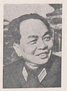
Gen. Giap, minister Obrony Półn. Wietnamu, używając taktyki Mao - Tse - Tung na wojnie partyzanckiej, stał się dla Amerykanów "twórczym orzechem do zgrzytania".

X Konferencja Międzynarodowej Komisji Dorzeza Parany (CIBPU) odbyła się w Urubupungá w ub. tygodniu w obecności 7 gubernatorów Środkowych i południowych Stanów Brazylii oraz prezydenta państwa. Na konferencji postanowiono przekształcić ten organizm w instytucję międzynarodową (w najbliższej przyszłości). W toku obrak okazało się, że Stany należące do powyższej organizacji przedstawiają 20 proc. powierzchni kwadr. kraju, 55 proc. liczby mieszkańców Brazylii oraz 70 proc. całej produkcji przemysłowej. Postanowiono również pracować nad realizacją wielkiego planu — połączenia dorzeza Amazonki z dorzezem Parany i Urugwaju, jako ważnego szlaku wodnego na przestrzeni 6 tys. km i łączącego kilkanaście państw Południowej Ameryki.