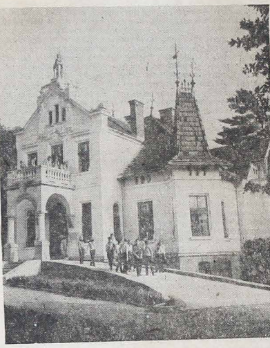
Pałac w Oblegorku — ofiarowany przez społeczeństwo Henrkowi Stenkiewiczonu, pisarzowi, który tworzył "Ku pokrzepieniu serc".

Prasa japońska, może najlepiej poinformowana o obecnej sytuacji w Chinach komunistycznych, donosi, że zaostrze się walki między "Czerwoną Gwardią" a tysiącami strajkującymi robotnikami z takich miast jak Szanghaj, Kanton, Nankin i Fungshaj. Walki powyższe weszły w morze, który zdecydować może o losie jednego z dwóch rywali: Mao Tse-Tung i Liu Shao-Chi — prezydenta Chin. Setki tysięcy robotników fabrycznych protestują przeciw redukcji zarobków miesięcznych narzuconej w imię "rewolucji kulturalnej". W Szanghaju doszło do bardzo krwawych starć, w których miało zginąć kilkanaście tysięcy osób. Podczas gdy Mao Tse-Tung ma za sobą "Czerwoną Gwardię" i większą część armii, Liu Shao-Chi opiera się na robotnikach i znacznej liczbie wyższych dowódców armii. Wydaje się, że minister spraw zagranicznych Chu En-Lai chce być rozjemcą między dwoma przeciwnymi obozami, apelował bowiem o zaprzestanie walki fratobójczych w Chinach. Mao Tse-Tung kontroluje już radiostacje oraz agencje prasową w Pekinie.