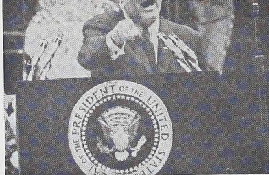
PARA A CRIAÇÃO DE UM CORPO NACIONAL DE MESTRES