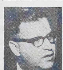
O chanceler do Israel, Abba Eban, afirmou, categoricamente, que seu governo não retirará as tropas do território árabe ocupado durante o recente conflito, enquanto a RAV não assinar o tratado de paz com Israel.

O escrutínio revelou que 98% dos delegados de Quebec se pronunciaram favoravelmente à resolução enquanto que numerosos delegados de outras províncias favoráveis à França votaram contra.