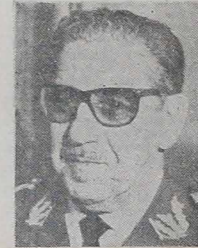
COSTA E SILVA W KURTYBYIE