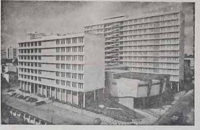
Piękny i nowoczesny gmach Rektoratu Uniwersytetu Paranańskiego w Kurytybie jest od szeregu lat centrum różnych imprez kulturalnych, dzięki uszanowanej sali koncertowej.

*** Holandia też ma bóle głowy ze studentami. Grupa studentów, należących do organizacji młodzieży w e i szkolnej, silnych emocji i występujących przeciw prepsom prawnym, obrzucał pomów krylowej Juljany bombami gazowymi, krzycząc równocześnie: "niech żyje republika". Stało się to w chwili, gdy królowa z całym dworem przejeżdżała ulicami w Hadze do parlamentu. Trzy tys. policjantów tworzyło kordon na ulicach. Trudno ustalić liczbę tej grupy studenckiej, posiadającej własny dziennik w nakładzie 15 tys. egzemplarzy. Kilka dni temu ci sami studenci przemawiali na białym posąg znanego patrioty hoenderskiego Jana de Vii, o przekonaniach republikańskich. Zajęcie powyższe zmusiło królowę by zabrać się w tej sprawie podczas mowy tronowej, podkreślając, iż młodzież obecnej potrzebnie jest odrodzenie duchowe, społeczne i polityczne.