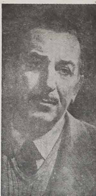
MORRIS WALT DISNEY

Recorda-se que o Programa das Nações Unidas para o Desenvolvimento foi criado em 1º de janeiro de 1966, com a fusão das duas principais operações de ajuda da ONU — ou seja o Programa Ampliado de Assistência Técnica e o Fundo Especial — que já vêm participando do desenvolvimento brasileiro há mais de quinze anos.