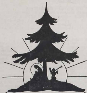
"Glória a Deus nas alturas Paz na terra aos homens de boa vontade".

Todo ano ouço esta mensagem, Senhor Menino-Deus! Recordam-me os Vossos ministros, as figuras de pastores; relembram o abandono a que os homens da época Vos telegraram: "Não havia lugar...". Revejo nos templos a mangedoura, o fumento e o boi, testemunhas de Vosso Natal.