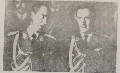
Durante a reorganização da Junta Militar, na Bolívia, os generais Barrientos (à esquerda) e Ovando Candia tomaram em suas mãos o governo e o comando das Forças Armadas daquele país.

REUNIAO ENTRE CATOLICOS E PROTESTANTES... NOVA IORQUE — A embaixada norte-americana "West House" firmou contrato com a Uniao Elétrica da Espanha para a construção da primeira central nuclear espanhola.