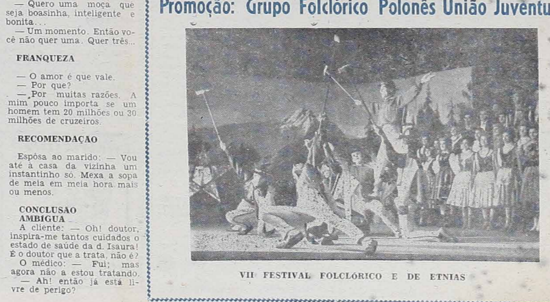
VII FESTIVAL FOLCLÓRICO E DE ETNIAS

Dia 6 de julho - às 20 horas - no TEATRO GUAIRA Promoção: Grupo Folclórico Polonês União Juventus