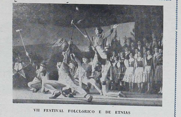
VII FESTIVAL FOLCLÓRICO E DE ETNIAS

Dia 6 de julho - às 20 horas - no TEATRO GUAIRA Promoção: Grupo Folclórico Polonês União Juventus