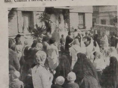
FRAGMENT PROCESJI BOŻEGO CIAŁA przy kościele świętego Stanisława w Kurtybié

szlachetnie Panu drogę do czterech otwartych: Najśw. Serca P. Jezusa, Dzieciątka Jezus, Najśw. Maryi Panny, Św. Franciszka.