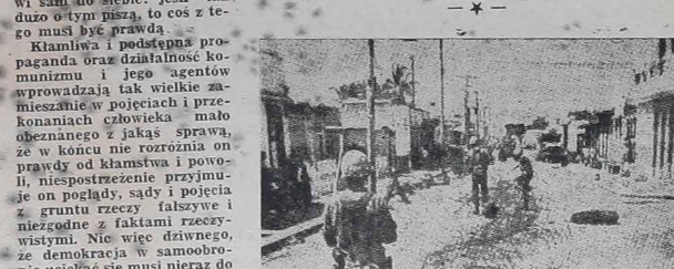
Zobierze Unii Panamerykańskiej — OEA — przeciągają druty kolczaste przez ulicę San Domingo, stanowiącą linie neutralną między obydwoma walczącymi obozami.

13 republik afrykańskich, należących do wspólnoty brytyjskiej (Commonwealth) odmówiły swego udziału w konferencji państw azjatycko-afrykańskich należących do tzw. "państw neutralnych" lub "trzecieli siły". Konferencja ta ma się odbyć w Kairze. Na próżno Pe-