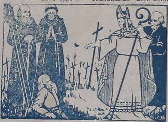
STO. ESTANISLAU, ressuscitando um morto para servir de testemunha.

Curitiba e delegações de outros Estados e cidades do Paraná, assistiram, aplaudiram e consagraram a abertura do Milênio Cristão da Polónia, durante o VII Festival Folclórico.