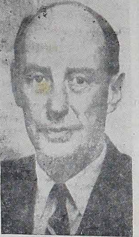
A morte repentina de Aklai Stevenson teve profunda repercussão no mundo inteiro

Fusão de Estados irá a debates — RIO — O Conselho Nacional de Economia decidiu entregar ao deputado Paulo Duque, da Assembléia Legislativa carioca, os trabalhos técnicos que executou sobre as vantagens da anexação do Estado do Rio de Janeiro à Guanabara, para que os debates tenham andamento na área legislativa.