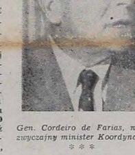
Gen. Cordeiro de Farias, nadzwyczajny minister Koordynacji.

3-roczny plan SUDENE przewiduje różne nowe inwestycje w sumie 145 miliardów kruczejrow, z czego największą przypadła na rozwój przemysłu rolnictwa i transportu.