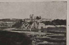
BÓCA TORTA E O TESTAMENTO

Durante o VII Festival Folclórico, que se realizou em Curitiba, foram abertas as comemorações do Milênio Cristão no Paraná. O Grupo Folclórico Polono Unio Juventus iniciou os festejos, investindo-se de brilho, cujo espetáculo, a pedido da plateia, mereceu reprise sob os auspícios da SUPOL.