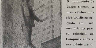
O monumento de Carlos Gomes, o mais célebre músico brasileiro erguido em sua memória na praça principal de Campinas (SP) - sua cidade natal.