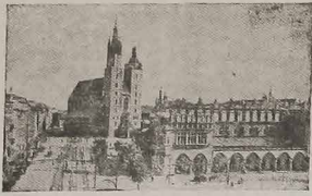
Vista atual de Cracóvia, antiga capital da Polónia e o principal centro de cultura polonesa...