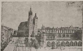
Vista atual de Cracóvia, antiga capital da Polónia e o principal centro de cultura polonesa...