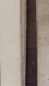
Robert Kennedy, senador dos EUA, visitou vários Estados do Brasil

um busto humano. Explicou que não se trata de nenhuma ilusão ótica nem dobra da tela, pois o reflexo acompanha a curvatura natural da córnea.