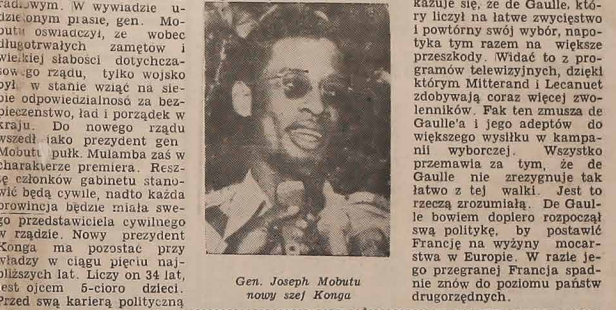
Gen. Joseph Mobutu nowym szef Kongu