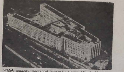
Widok gmachu naczelnego dowództwa Paktu Atlantyckiego w Paryżu — (Według "Wlodo")

Członkowie Episkopatu Polskiego na Soborze Powołanym w obecności Ojca św., zawzięcie polecającemu granicy polsko-polskie operacje. Biskupi polscy pragną wykorzystać obchody pierwszego tysiąclecia Chrześcijaństwa w swojej ojczyźnie, aby je przekształcić w odpowiednią okazję do skonczenia ze starą nienawścią. Niektóre koła zauważyły, że sam Papię mógłby zająć się tym tematem, skoro studiując plan wykonania ogłoszonego plan wyjazdu do Polski w czasie uroczystości przyszłorocznych. Inni przypuszczają, że inicjatywa biskupów polskich powiększy możliwość podjęcia papieskiej do nich kraju kiedyś pralicy Niemiec, czyżby zgodą się na pojednanie. Episkopat Polski wysłał listy do pięćdziesięciu i jednej grupy narodowościowych lub regionalnych biskupów zagranicznych na soborze, zapraszając ich do wzięcia udziału w obchodach 1965 roku. Oprócz tego list ten zawiera odpowiednie przywołanie do urzędniczego i politycznego kierownictwa niemiecko-polskiego. (Korespondent dziennika "O Globo").