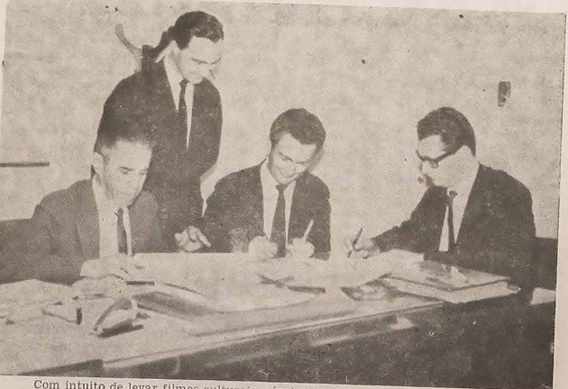
Com intuito de levar filmes culturais e instrutivos às comunidades do meio rural, foi firmado, dia 18 do corrente, convênio entre a Superintendência do Meio Rural, foi (SUPOL) e a Fundação de Assistência ao Trabalhador Rural (FATR).