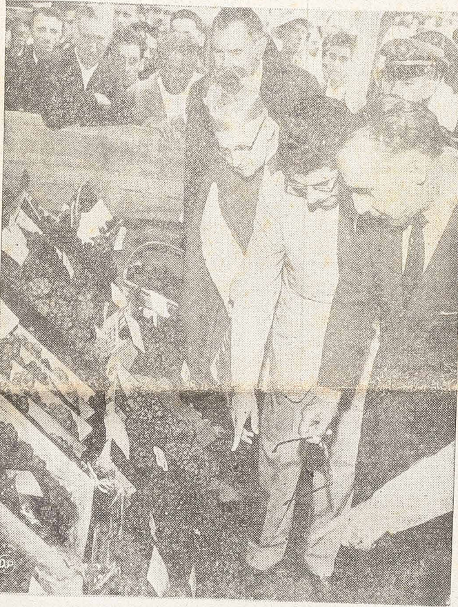
W CAŁYM KRAJU ODBYWAJĄ SIĘ OKAZYJNE UROCZYSTOŚCI. Na zdjęciu — fragment wystawy urządzonej w Santa Felicidade koło Kurtyby.