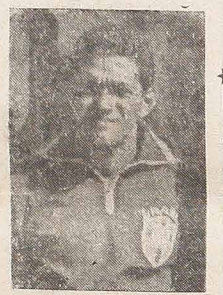
Garrincha, o estupendo ponta direita, que faz sobra ao próprio Pelé.

* Brasília — Selo especial comemorará a visita ao Brasil do presidente Kennedy — Um selo comemorativo da visita que o presidente John Kennedy fará em breve ao Brasil será emitido por determinação do Ministério da Viação. O Governo retribuirá assim o manifesto de cortesia que os Estados Unidos tiveram, lançando um selo em homenagem ao presidente Goulart, por ocasião de sua viagem aquele país.