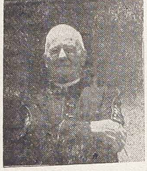
Não foto, o distinto sacerdote jubileante, amigo sincero de numerosa Colônia Polonesa de São Marcos.