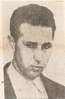
Ben Bella primeiro ministro da Argélia, tomou parte na reunião da ONU em Nova York.

— Ivo Arzua será novo prefeito de Curitiba.