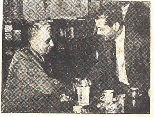
Gubernator Brizola i general Machado Lopes - podają sobie dłoń na znak wspólnego działania.

ciaw niemu również z bronią w rękę. W tym tak dramatycznym momencie - nowy Prezydent