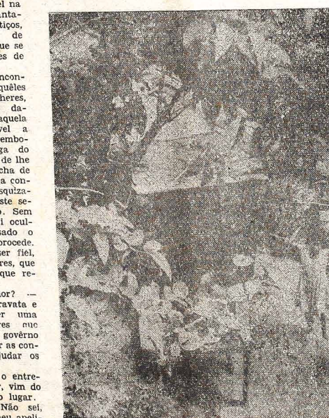
As moradas de favelados constituem um sério problema à higiene e à moral

— Qual é a sua ocupação? — Nenhuma, doutor. Faço qualquer coisa e vivo da boa vontade dos outros. Alguns me deixam morar neste rancho (favela), outros me dão um pedaço de pão seco, em troca da le-