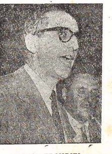
ARTURO FRONDISI — Prezydent Argentyny

Od dłuższego już czasu notowano niechęć armii syryjskiej do prezydenta Arabijskiej Republiki Zjednoczonych (RAU) — Nassera. Przyczyną tego było lekceważenie traktowanie Syrii przez Egipt (Nassera) oraz skradzenie kluczowych stanowisk w armii syryjskiej przez dowódców egipskich. Bunt Syrii przeciw Nasseroowi wybuchł w mieście Damasko, kierowany przez wyższych oficerów syryjskich, którzy za wszelką cenę chcą oderwać Syrię od Arabijskiej Republiki, twierdząc, że zaletą jest przyniesienie Syrii w ten sposób stracił niż korzyści. Rewolucjonści syryjscy zwyciężyli. Wobec powstania poparcia przez większość wojska i ludności, Nasser odwołał swą oddziały, by uniknąć otwartej wojny. Turcja i Jordania uznały już nowy rząd Syrii.