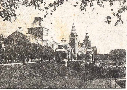
Z cyklu — Poznań Polskę: Szczecin. Waty Chrobrego. Gmach muzeum morskigo i zabytkowy zamek plastowski.

Katastrofa samolotu w której zginął generały sekretarz ONZ — Dag Hammarskjöld, nasunęło podejrzenie że spowodowana została zamachem, by wyeliminować przedstawiciela ONZ, znającego z swej energii i nieustraszonej odwagi. Podejrzenie to było tak silne, że ONZ nakazało przeprowadzić śledztwo, by zbadać bliżej okoliczności katastrofy, tym bardziej, że pośród 14 pasażerów zanoto-