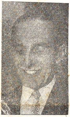
CARVALHO PINTO — Gubernator Stanu São Paulo

Nowe salário mínimo: Prezydent Państwa, bawiąc ostatnio w São Paulo, zapowiedział na najbliższe dnię ustanowienie nowej minimalnej płacy miesięcznej dla wszystkich pracowników ze względu na znaczny wzrost cen artykułów pierwszej potrzeby. To postanowienie Prezydenta było naprawdę nagłe, bo dotychczasowe "salário mínimo" wynoszące w Paranie 7.200,00 kruczerów było faktycznie nie wystarczające dla rodzin robotniczych, posiadających kilkoro dzieci w wieku szkolnym. Niezadowolenie tej klasy było słuszne i uzasadnione, biorąc pod uwagę, że kosztła utrzymania w ostatnich miesiącach poszły 66 procent w zwyż. Trzeba ekonomicznie na innym polu, a nie kosztom pracy robotnika. — Prezydent Goulart dodał jeszcze, że za wszelką cenę musi się ustabilizować ceny najważniejszych artykułów. Jeśli "salário mínimo" ma być polepszeniem bytu dla wielkich rzesz pracujących. Gabinet otrzymał "votum zaufania". Nowy rząd z prezydentem Tancredem Neves na czele otrzymał od Kongresu "votum zaufania" 178 głosami. Innymi słowy — parlament zgodził się z działalnością i postępowaniem