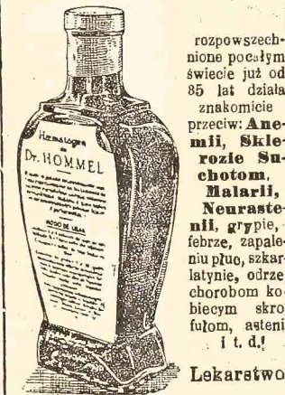
HAEMATOGEN D-ra Hommela działa skutecznie.

Słynne lekarstwo HAEMATOGEN DRA HOMMEL/A