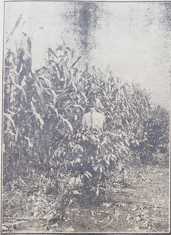
Kukurydza między kawą nową, na sprzedanych lotach przez Kompanję. Stacja kolejowa w Londrinie