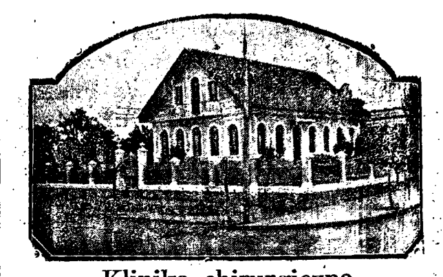
Klinika chirurgiczna przy ulicy 7 de Setembro N. 69, narożnik ulicy Bateliffa — Telefon N. 448.

Wysprzedaje, z powodu wyjazdu do kraju z rodziną wszystkie towary swego sklepu po cenach bardzo niżonych, jakoteż sprzedaje wszystkie swoje nieruchomości składające się z domu dużego na głównej ulicy miasteczka w najlepszym punkcie na handel. Korzystajcie z okazji!!!