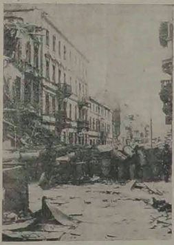
Barykadny na ulicach Warszawy