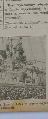
Matarynka Wojenna w porcie Buenos Aires w przełomowych dniach rewolucji.