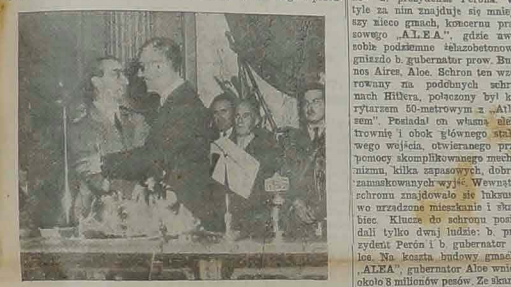
Prezydent Lonardi i Vice-Prezydent Rojas w „Casa Rosada” w dniu 20 września b. r.