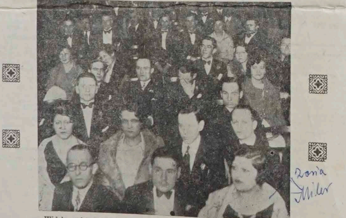
Widok części widowni podczas Uroczystej Akademji w „Domu Polskim”

tylko poto, by mając je na pamięci, by mając na pamięci zło wielkie, jakie przyniosły pracy społecznej starości się by się nie powtarzały.