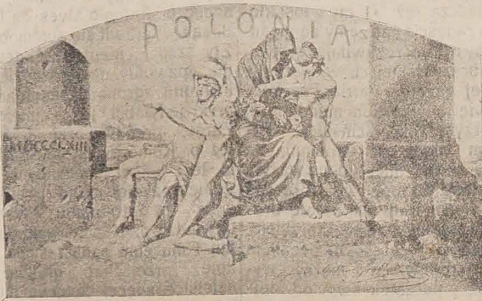
Rozrywanie więzów Polski—według obrazu Grotzgera z 1863 roku. Ilustracja tytułowa dzieła.