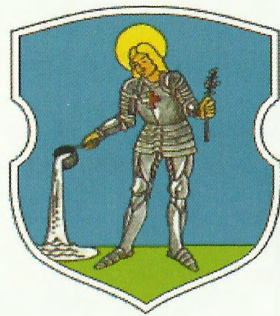
Герб Мглина (1626 г.)