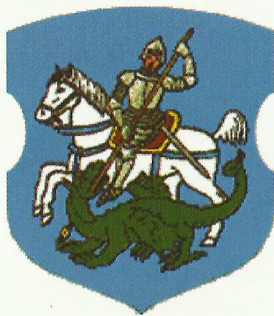
Герб Красного (1625 г.)