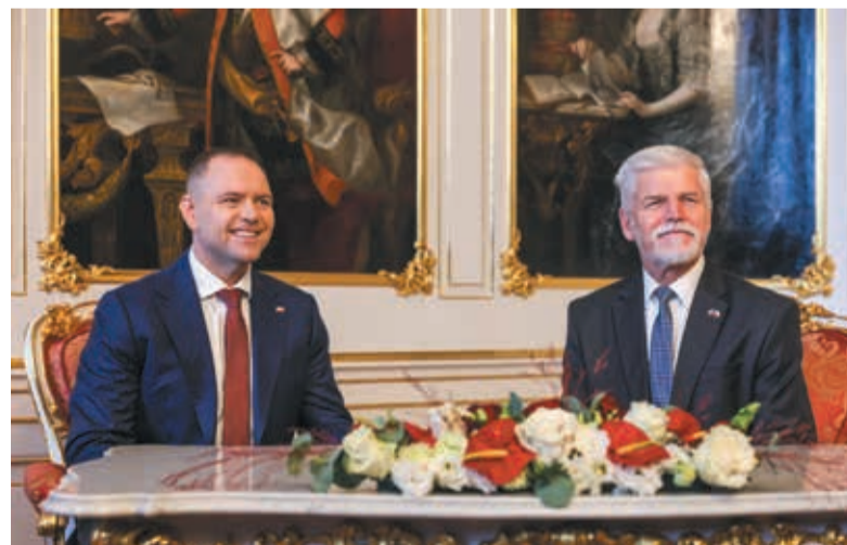
• Prezydenci Karol Nawrocki (z lewej) i Petr Pavel na wspólnym zdjęciu.

Pavel spodziewa się po kontaktach z nowym polskim prezydentem, że ich komunikacja będzie otwarta i rzeczowa, bez uciekania się do przesadnej poprawności politycznej. (dc)