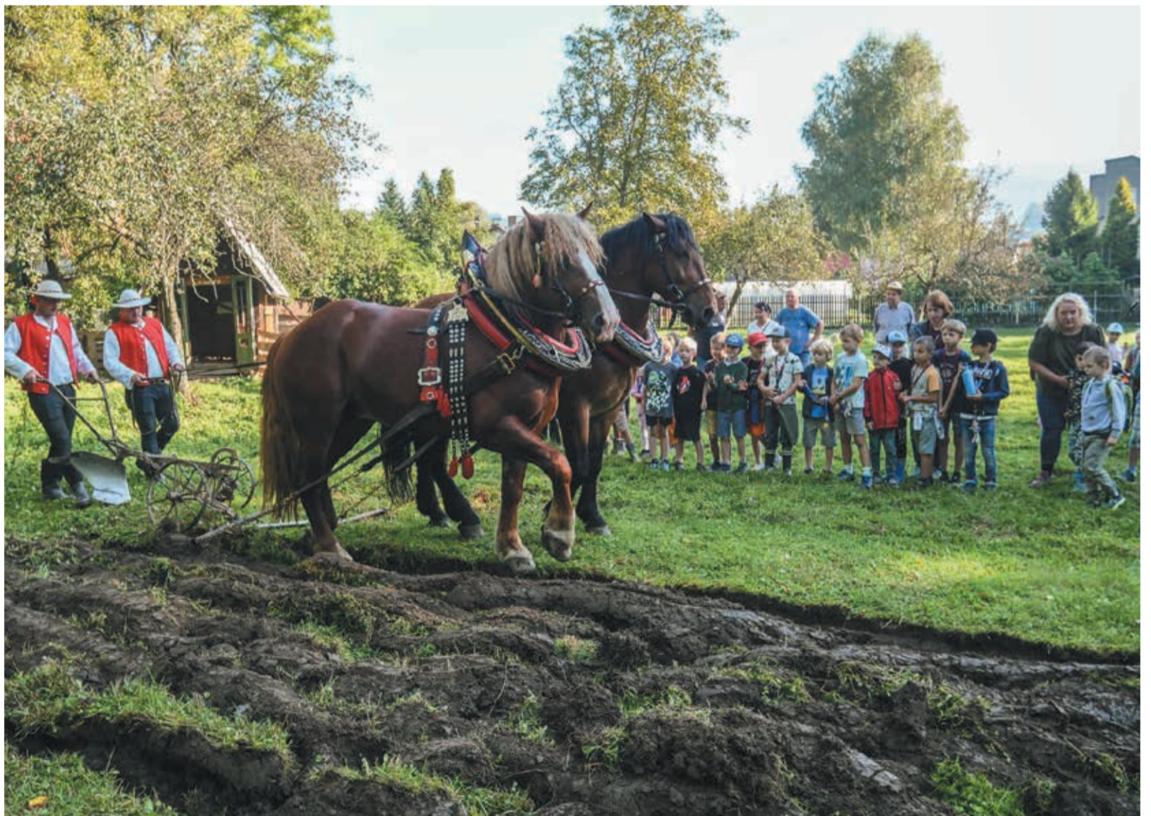
• Dzieci z polskiej i czeskiej szkoły z bliska mogły zobaczyć, jak kiedyś wyglądała praca na roli.

MK PZKO w Jabłonkowie zaoferowało działkę (Mazurowice), a członkowie MK PZKO w Piosku zadbał o program dla dzieci oraz krzycę do zasiania. Na miejscu można było z bliska zobaczyć m.in. stary wóz i narzędzia rolnicze, jak pług, brony czy grabie. Największą atrakcją był jednak pokaz orania z końmi. W wydarzeniu wzięła udział ok. setka dzieci wraz z nauczycielami z polskiej podstawówki im. H. Sienkiewicza