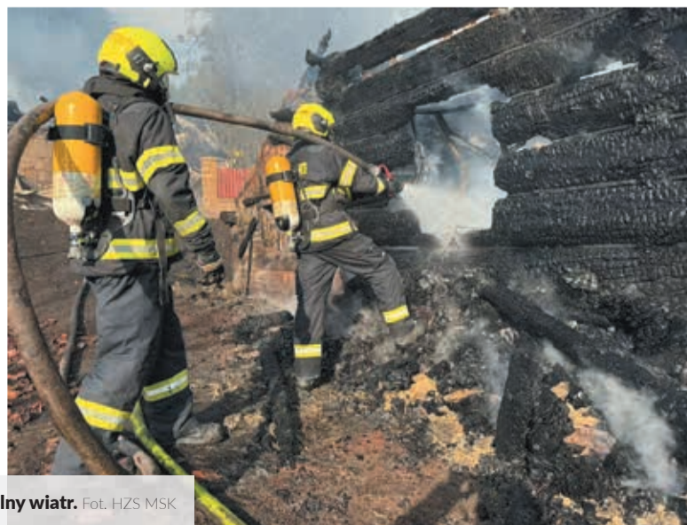
• Akcję gaśniczą w Bukowcu utrudniał silny wiatr.