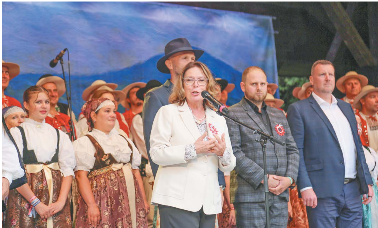
• Małgorzata Kidawa-Błońska, marszałek Senatu RP, była zachwycona tym, co zobaczyła w niedzielę w Lasku Miejskim w Jabłonkowie.

– Szanowni goście, widzowie, witam was na 78. międzynarodowym festiwalu folklorystycznym, witam was na „Gorolskim Święcie” w Jabłonkowie – powiedział, kierując szczególne słowa powitania do marszałek Senatu RP.