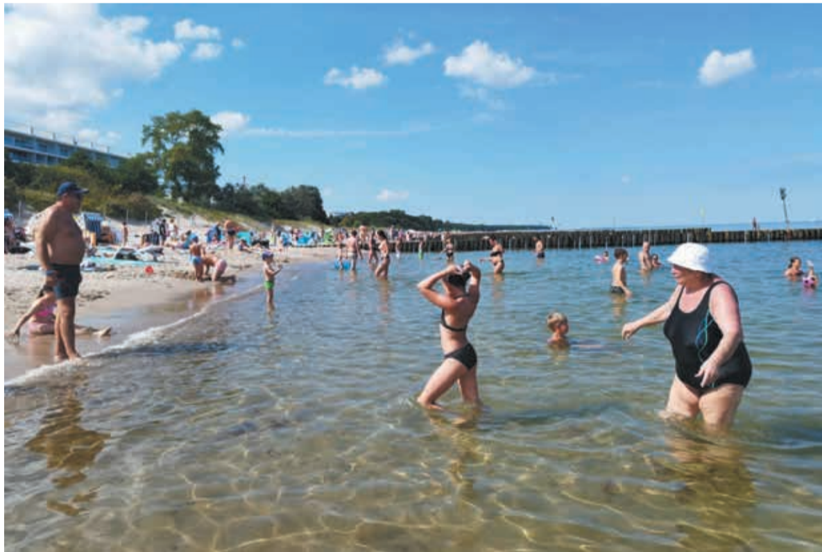
● Morze Bałtyckie to numer jeden na liście wakacyjnych kierunków Polaków. Wśród miast dominuje Kołobrzeg, który wyprzedza Gdańsk.

Wakacje w Polsce chętnie spędzają także mieszkańcy Zaolzia. Helena