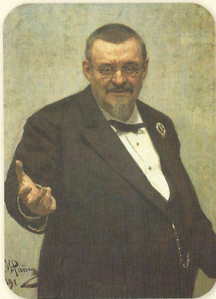
Владимир Спасович Художник И. Репин