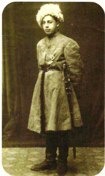
Георгий Бяллор, 1918 г.