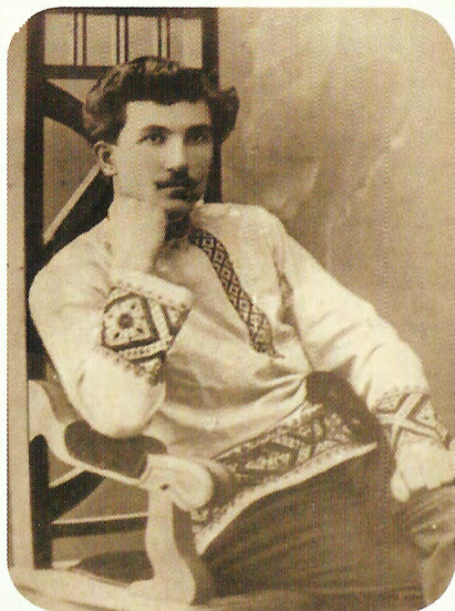
Владимир Косинский, 1912 г.