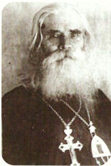
Епископ Александр Бяллор