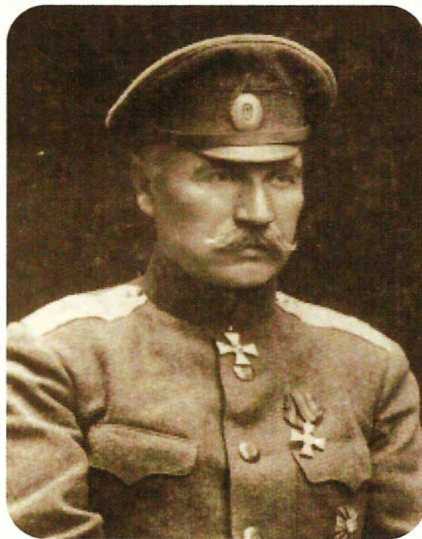
Юлиан Бяллор, ок. 1915 г.