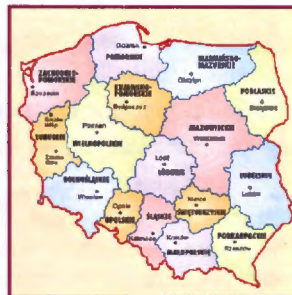
Los 16 Voivodatos (Wojewodztwa) de Polonia, de acuerdo a la nueva división política del año 1999