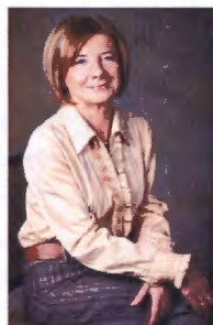
MARIA KACZYNSKA Primera Dama de Polonia