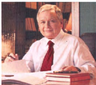
LECH KACZYNSKI Presidente de Polonia Elegido en las elecciones del 23 de Octubre de 2005, Juramentó como nuevo Presidente de la República el 23 de Diciembre del 2005, por un período de 4 años.

Polonia es una República Parlamentaria Bicameral de acuerdo a la Constitución de 1997. Forma parte de la Unión Europea y de la OTAN. Está ubicada en Europa Central, y limita con Alemania, República Checa, Eslovaquia, Ucrania, Bielorrusia, Lituania y Rusia. Su capital es Varsovia. El País tiene una superficie de 312,685 Km. y su población estimada en 38 millones de habitantes. El 95% de la población profesa la religión católica y existe solo el 1% de analfabetismo. Las fiestas nacionales son: el 3 de Mayo (Día de la Constitución) y el 11 de Noviembre (Día de la Independencia) Las actividades económicas mas importantes: manufactura de maquinaria industrial, producción de acero, hierro, aluminio, productos químicos, astilleros y pesca industrial, industria de alimentos, vidrio, bebidas, telas y tejidos. En la agricultura los rubros de mayor producción son: patatas, (5to. Productor mundial), frutas, verduras, trigo, remolacha, lúpulo, tabaco, avicultura, huevos y carne de cerdo. En minerales: carbón, azufre, cobre, gas natural, plata, plomo zinc, níquel, magnesita y sal gema.