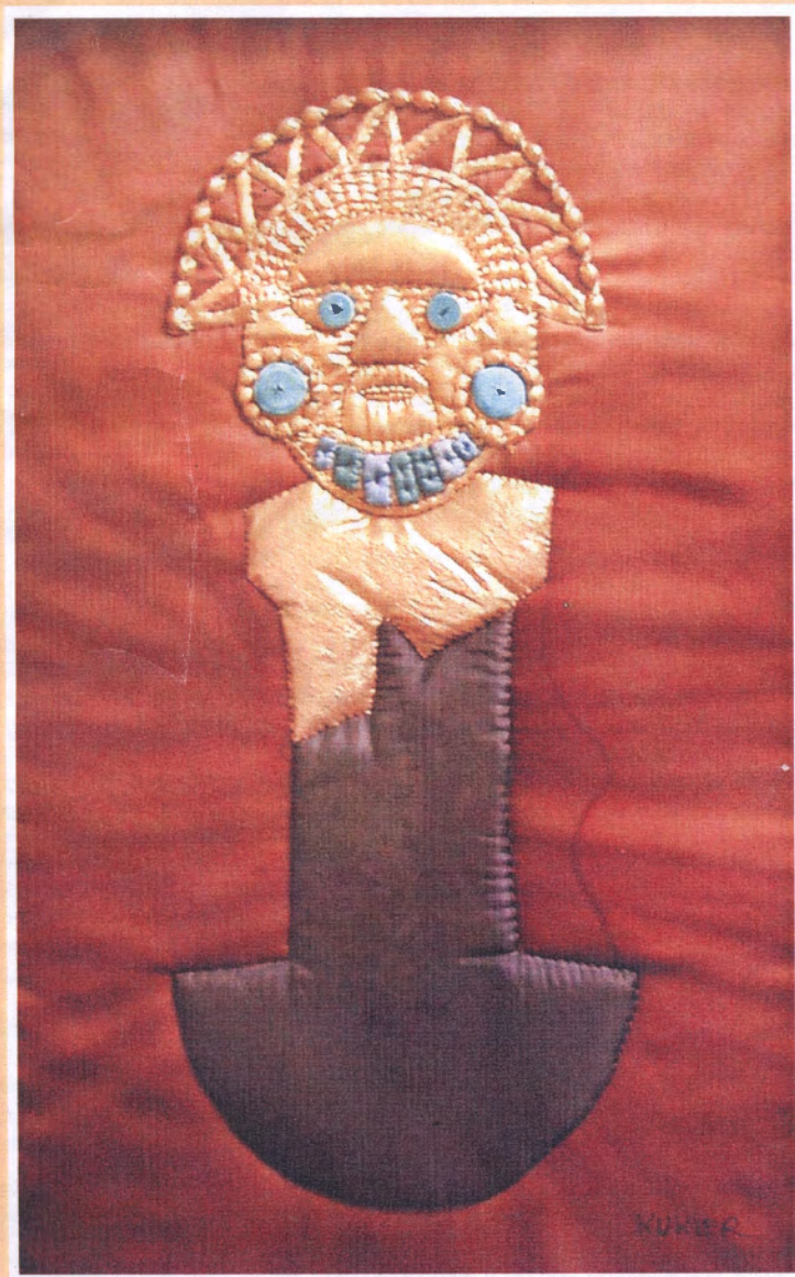
40 cm. x 60 cm. Quilt de Seda Natural