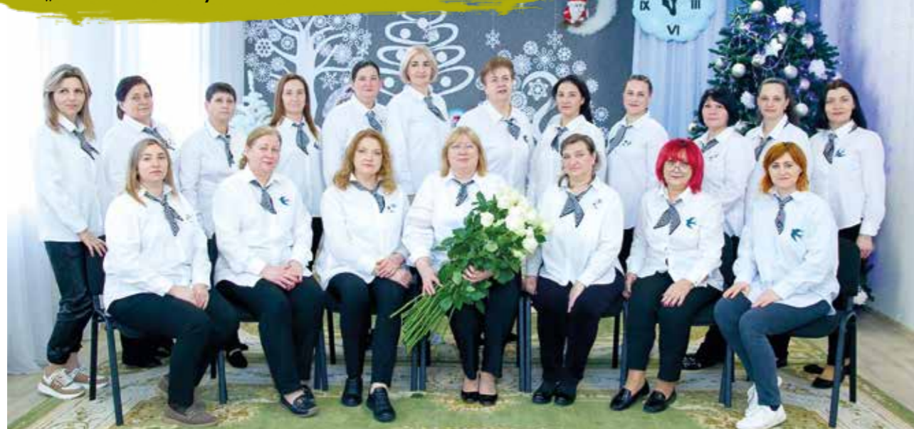
Grono pedagogiczne Przedszkola Nr 89 „Jaskółka” w Kiszyniowie