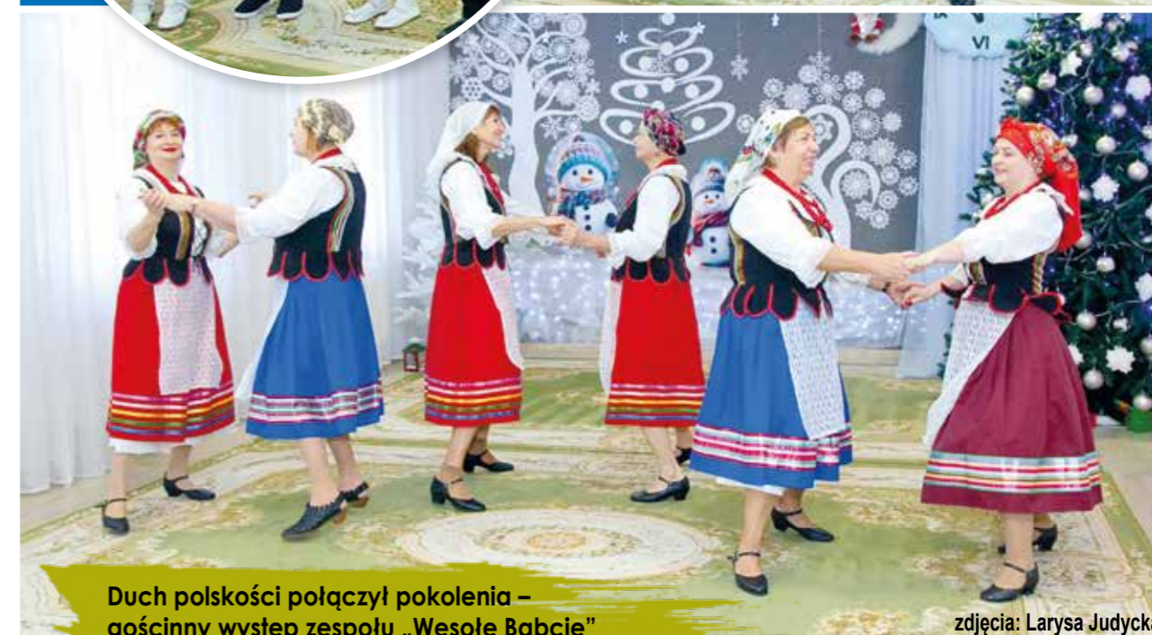
Duch polskości połączył pokolenia – gościnny występ zespołu „Wesołe Babcie”