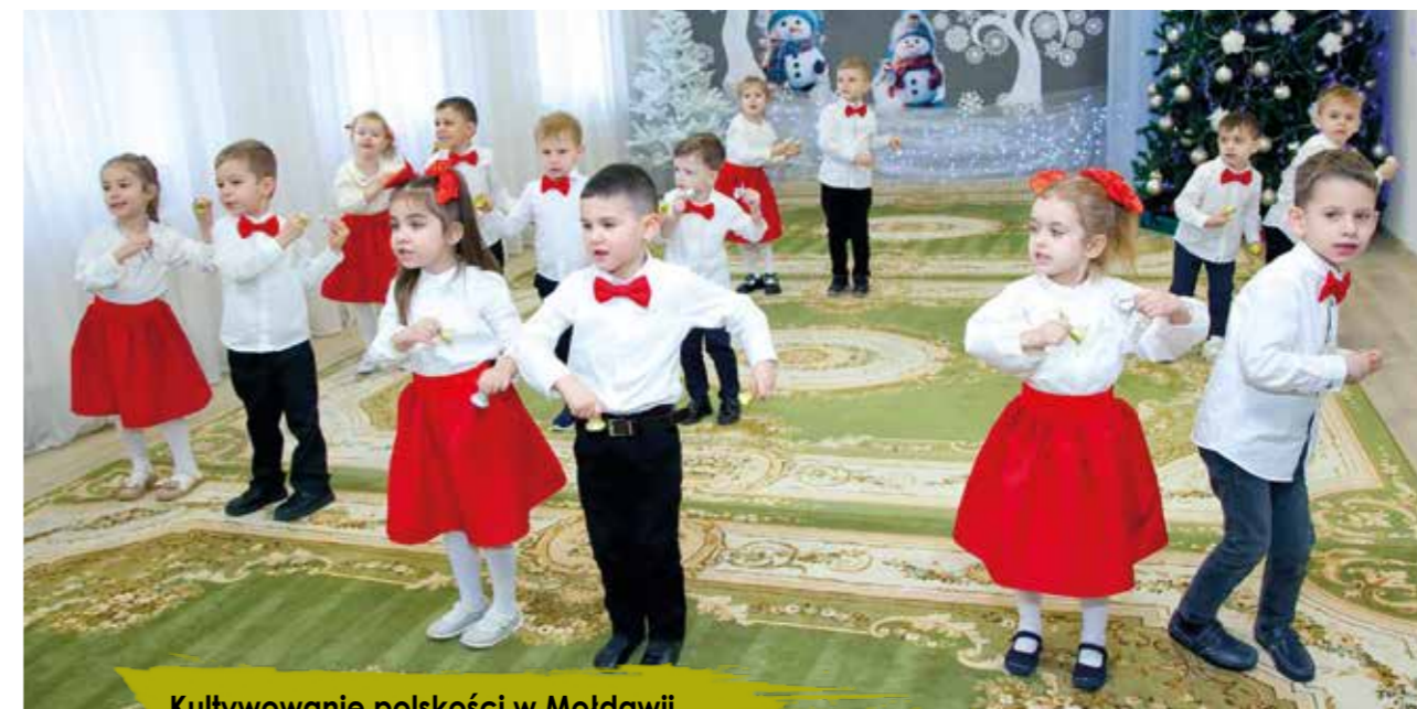
Kultywowanie polskości w Mołdawii to zasługa takich miejsc jak przedszkole w Kiszyniowie

Przedszkole Nr 89 „Jaskółka” działa od 1964 roku jako przedszkole publiczne. Placówka zapewnia warunki do wielokierunkowej aktywności, organizując różnorodne, ciekawe formy zajęć. Przedszkole skutecznie wspomaga rodzinę w ukierunkowaniu rozwoju dziecka, zgodnie z jego wrodzonym potencjałem i możliwościami rozwojowymi. Oferuje zajęcia z językiem obcym – angielskim lub polskim. Młodzi kiszyniowianie, którzy są dwujęzyczni, uczą się nowych słów w języku obcym praktycznie równocześnie z opanowywaniem nowych zasad mowy w językach rumuńskim i rosyjskim, co daje bardzo dobre efekty. (jk)