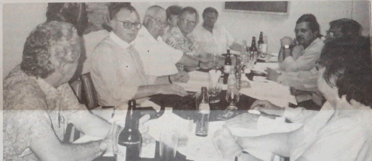
Os encontros nas comunidades têm sido produtivos: todos os polônicos entusiasmam-se com a perspectiva de comparecerem ao II CPAL, em Curitiba, em março.

restaurada e devidamente mobiliada, onde já funciona a sede do Congresso com o seu escritório devidamente equipado.