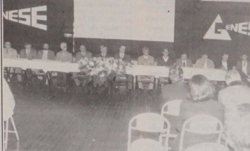
Os novos dirigentes da Cultural Abranches, no salão nobre da entidade, quando da posse oficial para a posteridade. O novo comando promete dar continuidade ao crescimento do importante clube de Curitiba.